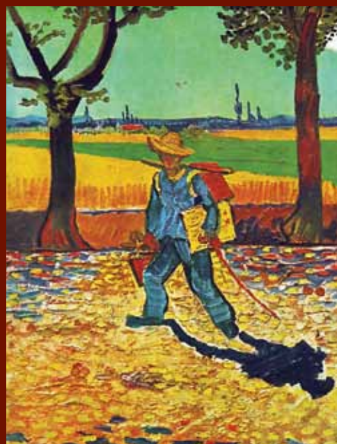
Van Gogh sur la route de Tarascon. Détruit durant la Seconde Guerre Mondiale.